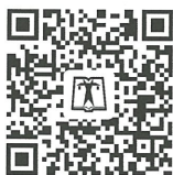
中国电力出版社官方微信