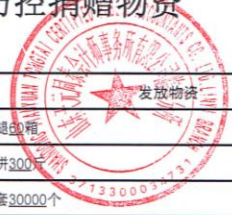
附表5：莒南县红十字会疫情防控捐赠物资 发放情况表