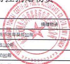
附表4：莒南县红十字会疫情防控捐赠物资接受情况表