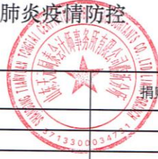
附表1：莒南县红十字会接受新冠肺炎疫情防控 捐赠资金明细表